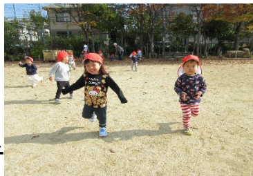
森具公園にて戸外遊び