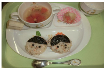
ひなまつりメニュー