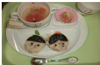
ひなまつりメニュー