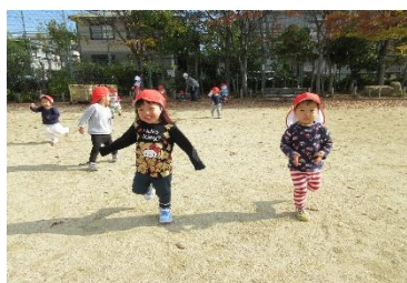
森具公園にて戸外遊び